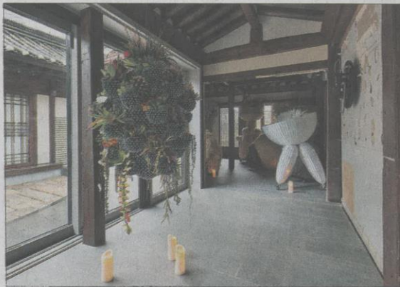
국제갤러리에서 10월 8일까지 열리는 양혜규의 전시 '동면가옥'. 한옥 곳곳에 향아리와 오브제 작품들이 들어차 있다.

작가는 이 장소에서 '청소한다'와 '전기를 연결한다'라는 두 가지 과제를 수행한다. 이 과정은 전시의 일부이기도 했다. 청소와 전기 문제가 해결되자 작가는 깨진 거울, 조명 기기, 벽걸이 시계, 팔레트 건조대와 의류 행거 등 작품이 되기보다 또다른 폐가의 버려진 물건에 가까운 오브제를 설치하기 시작한다.