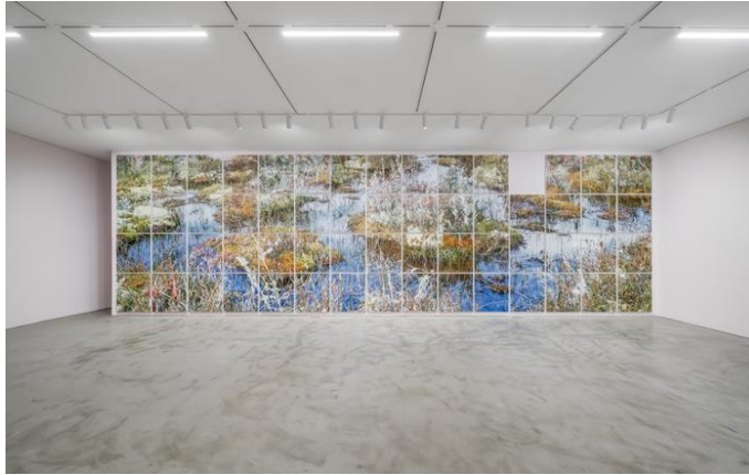
뉴질랜드 습지를 그린 'Untitled 4819' 연작. 오른쪽 위에 그림 하나가 비어 있다. [국제갤러리]

'이빨'이 하나 빠진 59개의 직소 퍼즐(jigsaw)이 눈앞에 펼쳐졌다. 세로·가로가 90·81cm인 직사각형 그림이 무려 12m 폭이 넘는 벽에 뽁뽁하게 걸렸다. 가까이서 보면 거친 붓자국이 바람처럼 휘몰아치는 추상화, 멀리서 보면 습지를 그린 구상화다.