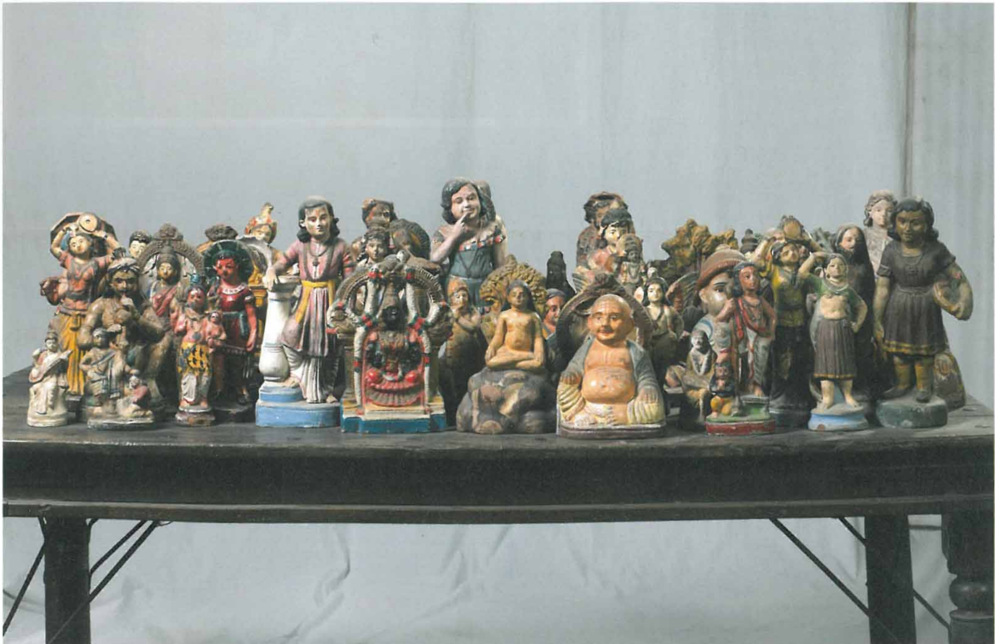
A vegetarian lion, a slippery fish, 2013. Table, plaster, paint, 70 figures, 118x172x113(cm)