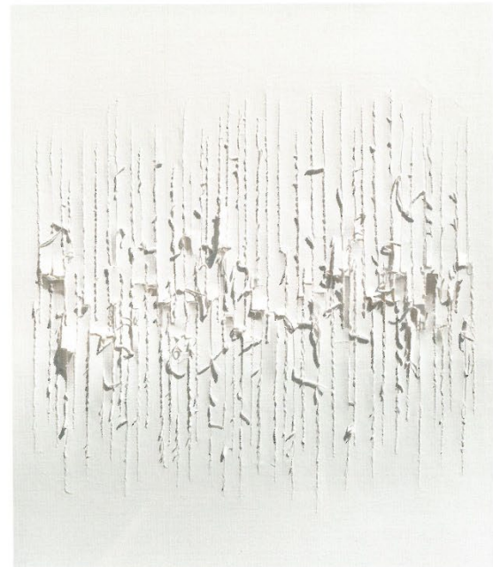
<무제(Untitled)> 1982 한지 121x94cm