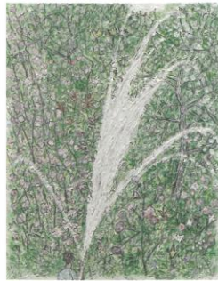
<정원과 나> 2021 캔버스에 젯소, 연필, 아크릴과슈 41×32cm

한편 특유의 따뜻한 시선으로 우리의 오늘날에 대한 이야기를 이어가는 작가의 태도는 여전하다. 다만 점차 어둡다고 표현할 수 있을 정도로 복잡 미묘한 세상 이면의 이야기들을 가시화하는 데 흥미를 느끼고 있다고. 그는 이제 더욱더 철저히 별 볼일 없는 평범한 일상에서 마주하는 순간의 아름다움에 초점을 맞춘다. 지금, 여기, 우리가 살아가는 세계에서 포착한 일견 특별한 것 없는 풍경들, 즉 꽃이 피고 시드는 순간, 계절의 순환, 번식기의 동물들을 그린다. 그리고 필연적으로 지게 되는 생명의 존재 등이 모여 만들어내는, 삶