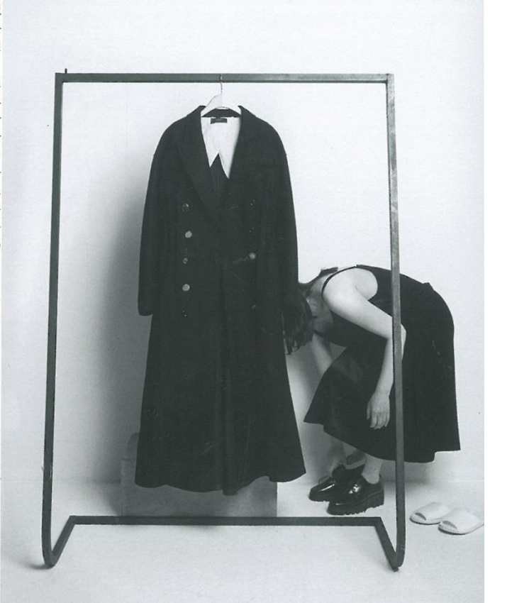
테일러드 롱 코트는 조셉(Joseph), 슬립 드레스는 플루 드 클레어(Clue de Clare), 로파는 렉켄(Rekken).

라파예트 작업이 철거될 무렴, 풍피두 센터에서는 양해규 의 아타스트 토크가 열렸다. 지난봄부터 풍괴두의 입구에 전시 된 블라인드 작품 '링거링 누스(Lingering Nous)'에 대한 이야 기와 양해규의 조형 언어로서 가장 결정적이고도 대표적인 역 할을 한 블라인드 작품을 일별한 책 작업을 위한 자리였다.