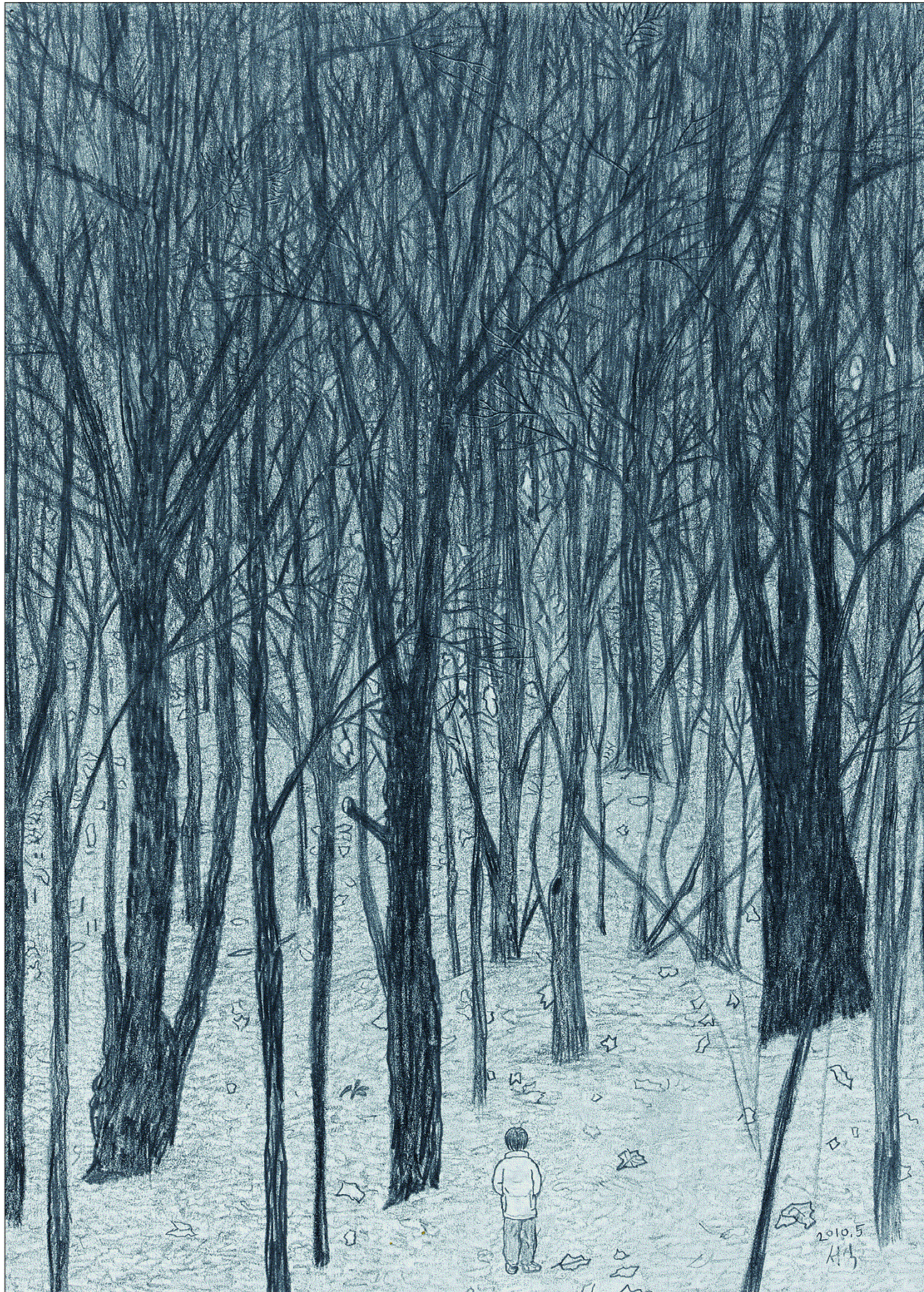
어린 시절 형과 함께 토끼를 잡으러 뒷산 깊숙이까지 올랐다가 어둠에 쫓겨 황망히 하산했던 기억을 그린 문성식의 '숲과 아이'. 아름답리 나무 숲 사이로 찾아든 어둠과 어린 소년을 군더더기 없는 간결한 연필 드로잉으로 세밀하게 표현했다.