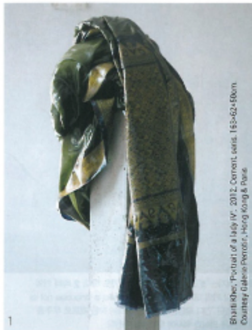
1 지난해 홍콩 페르모 갤러리에서 선보인 작품으로, 인도 전통 의상 사리를 활용해 여성상의 무채를 미묘하게 묘사한다. 2 바티 커의 빈디 페인팅 연작과 설치 작품 'Time Lag'(2013)이 설치된 국제갤러리의 전시장 전경. 문과 기둥이 충돌하는 형태의 'Time Lag'시작은 '집'이라는 공간 안에서 자형과 역학 관계에 대해 이야기하는 작품이다. 더불어 직기의 실경에 따르면 좋은 예술을 만들 때 시간이 멈추는 듯한 느낌을 시각적으로 표현한 작품이기도 하다.

그녀의 낯빛과 작품을 볼 때 반사적으로 떠오르는 예술가가 있으니, 바로 영국을 대표하는 조각가 아니시 카푸어다. 영국인 특유의 자적인 당당함, 범접할 수 없는 영적 깊이를 타고난 듯한 인도인 특유의 분위기가... 라몬메 동과 서의 두 인자가 결합된 작가들에게서 더 비범한 이야기가 읽힐 거라는 기대감은 때때로 주요하지 않던가. 그러나 명상적이고 철학적 깊이가 남다른 작업을 한다는 점을 뱉다면, 이들의 삶은 정반대의 궤적을 그리고 있다. 아니시 카푸어가 인도에서 태어나 영국으로 건너간 반면, 바티 커는 영국에서 인도로의 삶을 떠났다. 부모님의 나라 인도로 배낭여행을 떠나 그곳에서 '수보드 굿'을 만나 결혼하며 뉴델리에 정착했고 비로소 작가가 되었으니 동시에 그것은 그녀가 물리적 언어뿐 아니라 작가로서 자기 언어를