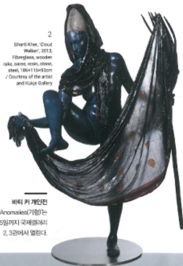
2 Bharti Kher, "Cloud Walker", 2013, Fiberglass, wooden rake, cane, resin, stone, steel, 186x115x93cm / Courtesy of the artist and Kukje Gallery

바티 커 개인전 'Anomalies(기형)'는 10월 5일까지 국제갤러리 2, 3관에서 열린다.