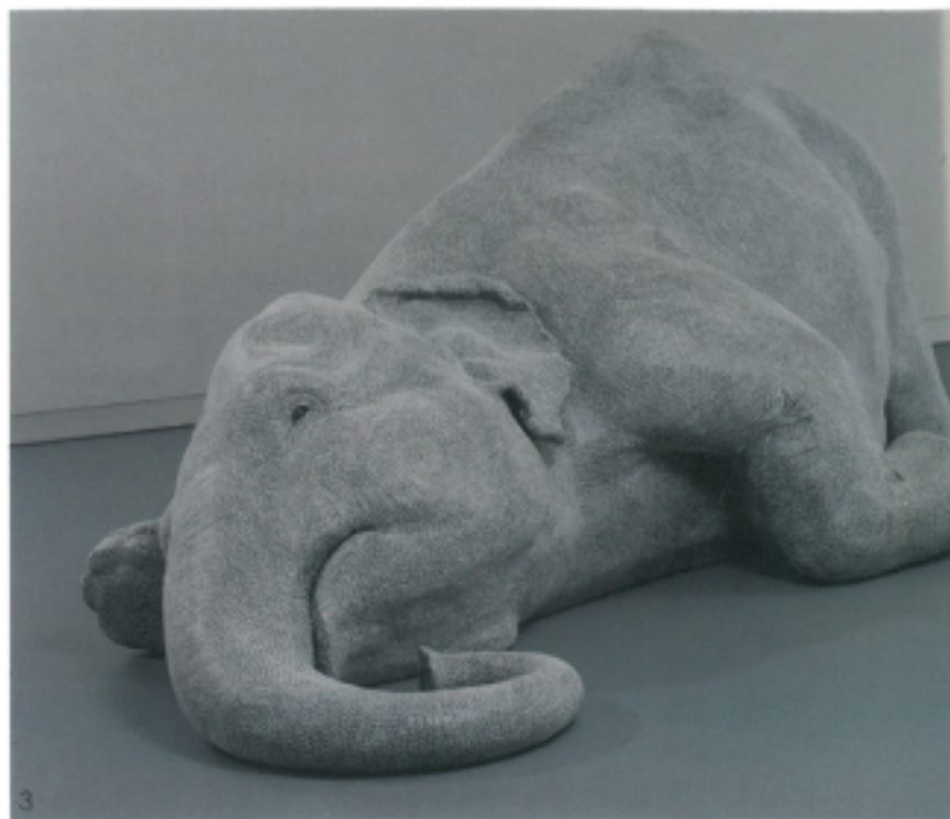
3 Bharti Kher / "The skin speaks a language not its own", 2006, Fiberglass, bindis, 142x46x195cm / Photo: Pablo Bartholomew/ Netphotograph.com / Collection KRAN NADAR MUSEUM OF ART