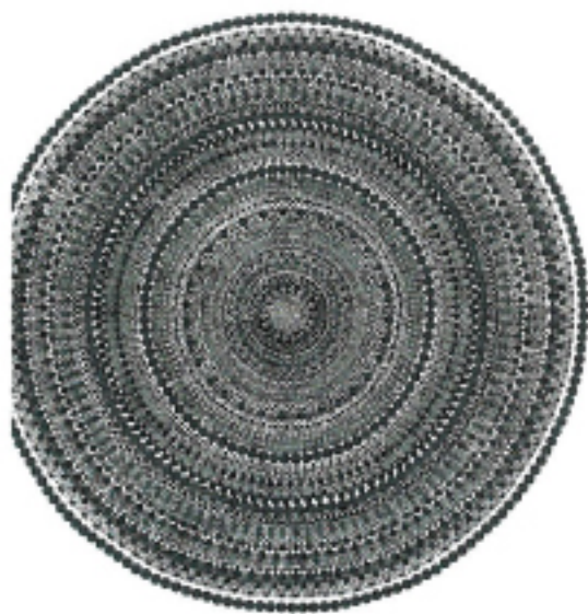
1 Bharti Kher, "Square a circle 3", 2012, Bindis on composite panel, Diameter: 150cm