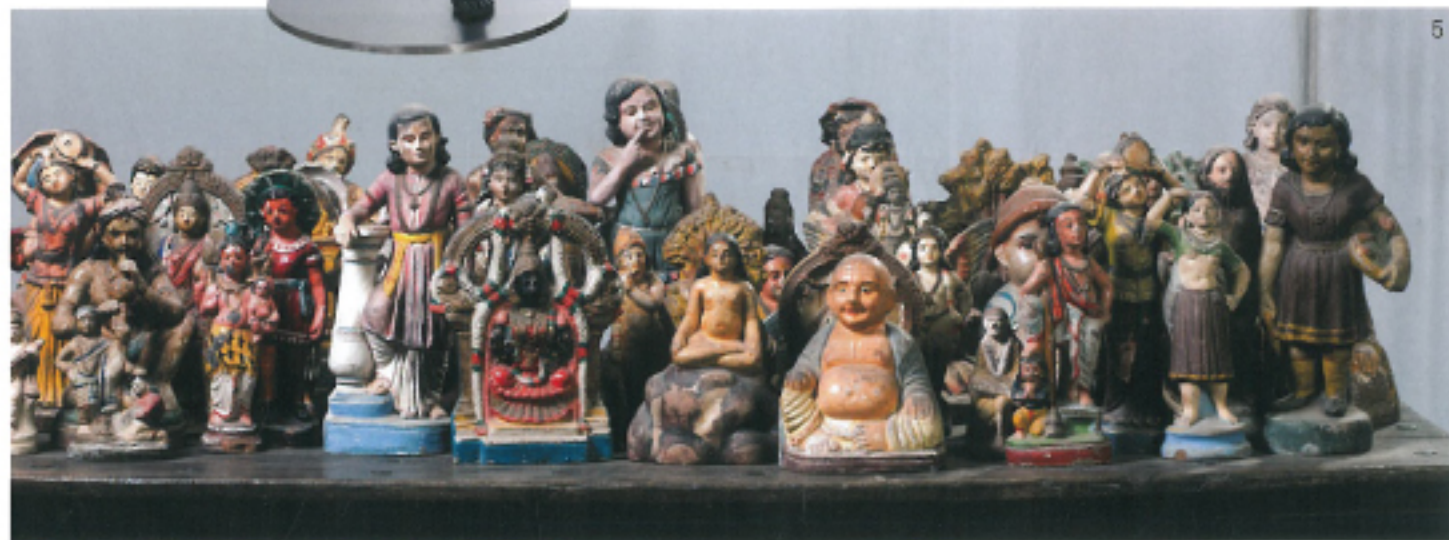
5 Bharti Kher / "K. vegetation lion, a slippery fish", 2013, table, plaster, paint, 70 figures, 118x172x113cm / Courtesy of the artist and Kukje Gallery

1 마치 만다라를 연상케 하는 바티 커의 만다 페인팅 '제외의 눈'이라는 뜻을 지닌 '만다'를 반쪽에서 붙이는 이 작업은 '보이는 것'과 '보여지는 것'의 개념에 대한 실험이기도 하다. 2 바티 커의 대표적인 연작 중 하나인 어신 시리즈. 막강한 성적 에너지를 대표하는 동시에 일탈의 변명이나 무고스러움이 없는 존재를 대변한다. 3 바티 커의 대표적인 'The skin speaks a language not its own'은 죽음 앞의 고카리를 묘사한 작품으로, 그 표면에 정자(sperm) 모양의 빈다가 붙어 있다. 4 자란에 울풍 비루탱 갈라에서 선보였던 '빈다 페인팅' 연작. 빈다라는 작은 재료로 우주를 표현하는 듯한 신비가 아름답다. 5 일제 종교적인 의미로 사용되던 수많은 오브제를 모은 작품. 기능은 사라졌지만 그 안에 내재된 수많은 의식과 역사에 대해 이야기한다.