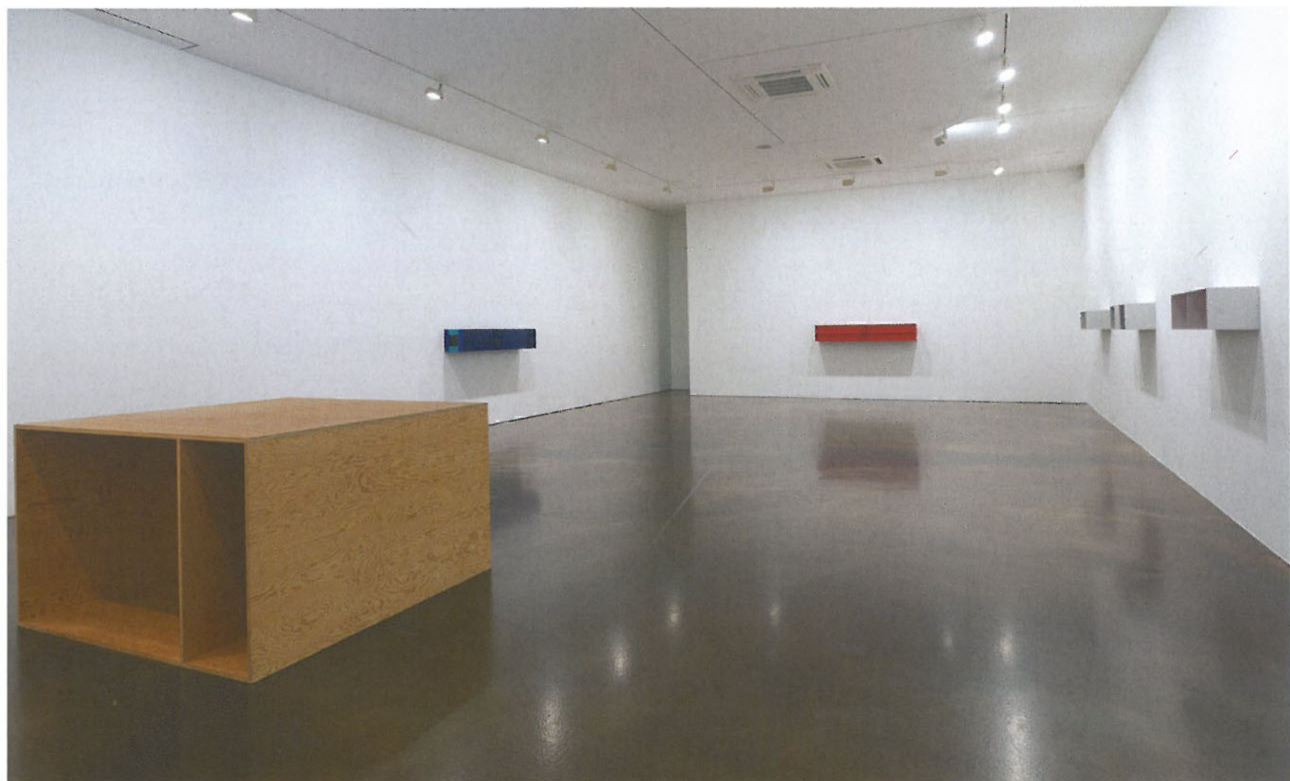
〈무제〉(왼쪽) 나무 91.5×152.4×152.4cm 1989

저드는 이 ‘알 수 없는’ 구조물들을 ‘특수한 사물들(specific objects)’이라 불렀다. 미니멀리즘의 필독서라 여겨지는 저드의 비평문 〈특수한 사물들〉(1965)은 바로 이 “회화도 조각도 아닌 것(neither painting nor sculpture)”을 상찬하는 문장으로 시작된다. 1 한때 사람들은 이 ‘알 수 없는’ 구조물들을 지칭하는 데에 ‘알 수