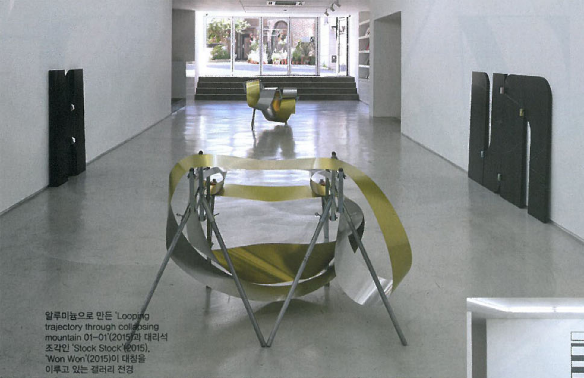
알루미늄으로 만든 'Looping trajectory through collapsing mountain 01-01'(2015)과 대리석 조각인 'Stock Stock'(2015), 'Won Won'(2015)이 대칭을 이루고 있는 갤러리 전경