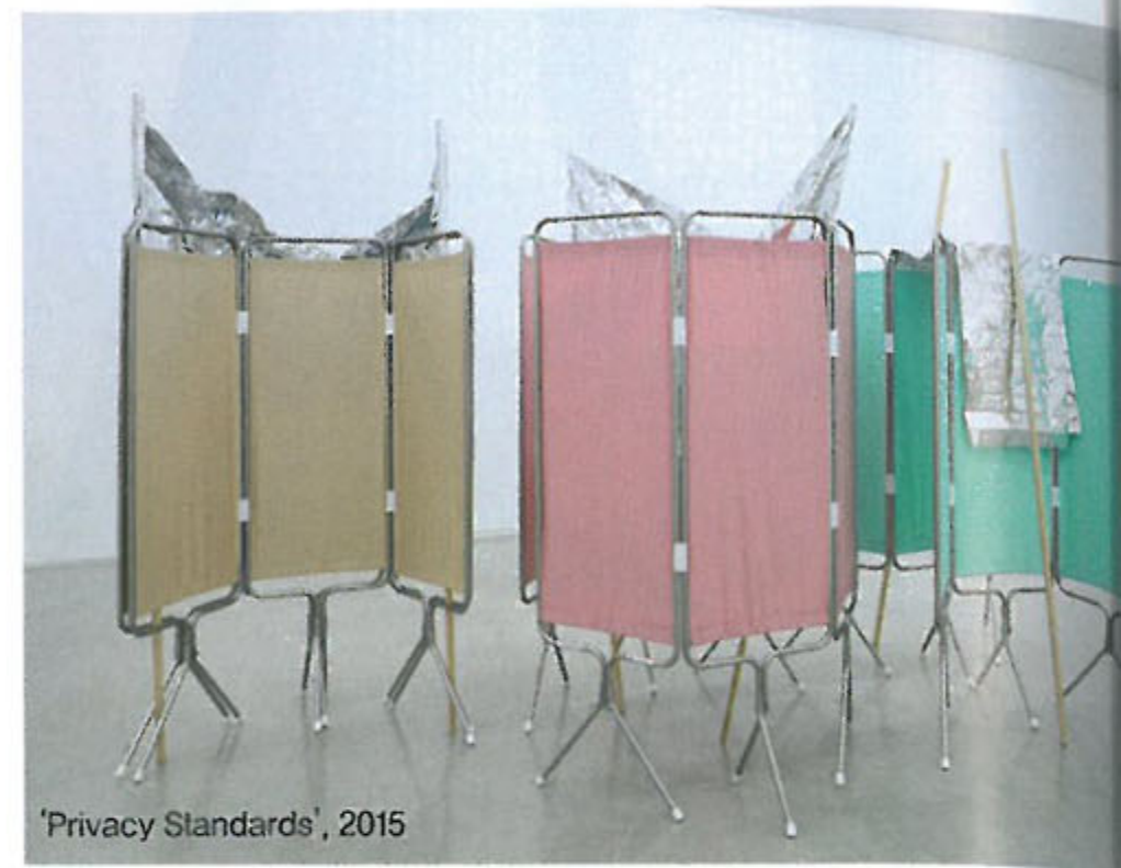
'Privacy Standards', 2015