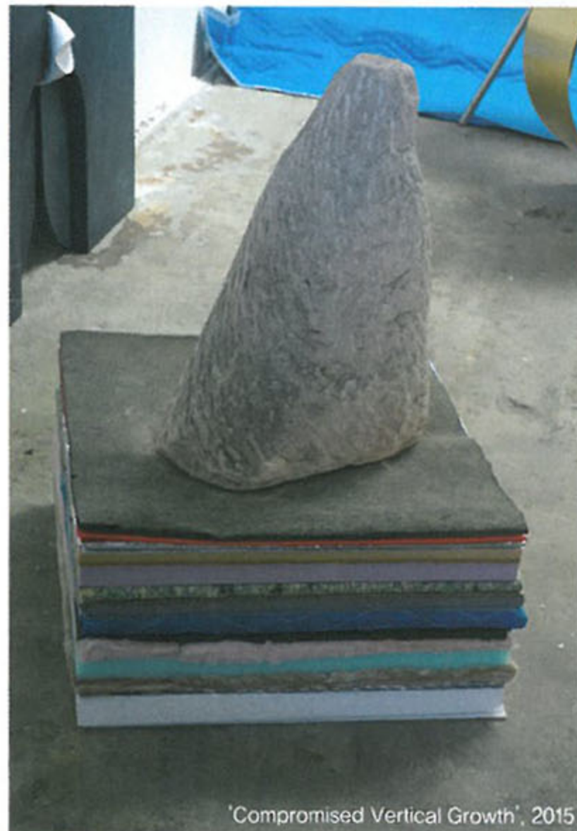
'Compromised Vertical Growth', 2015

한눈에 미적 감흥을 주지 않는다는 것이 오늘날 미술의 흠이 되지는 않는다. 당신의 작품은 아름답진 않지만 미학적이다. 오늘날의 예술작품이 미학적으로 갖춰야 하는 미덕은 무엇이라고 생각하나? 아름다움과 아름답다고 하는 선입견 사이에도 공통점이 있다. 그러나 사람들에게 이미 일반적으로 자리 잡은 아름다움에 대해서는 의문을 던지고 도전해봐야 한다고 생각한다. 시대에 따라서 아름다움에 대한 기준 자체가 달라지지 않나. 나는 무언가가 명확하고, 구체적이고, 충분하다면 기본적으로 미학적 요소를 갖추고 있다고 본다. 예로부터 예술이란 통상적인 미의 개념에 충격을 주면서 선보여왔고, 이로써 미의 개념은 끝없이 확장되고 있다. 그리고 예술가로서의 나의 가장 중요한 일 중 하나가 바로 예술뿐만 아니라 삶의 또 어디에 우리가 경험하지 못한 아름다움이 존재할지 찾아가는 것이라 믿는다. IB 에디터/윤혜정