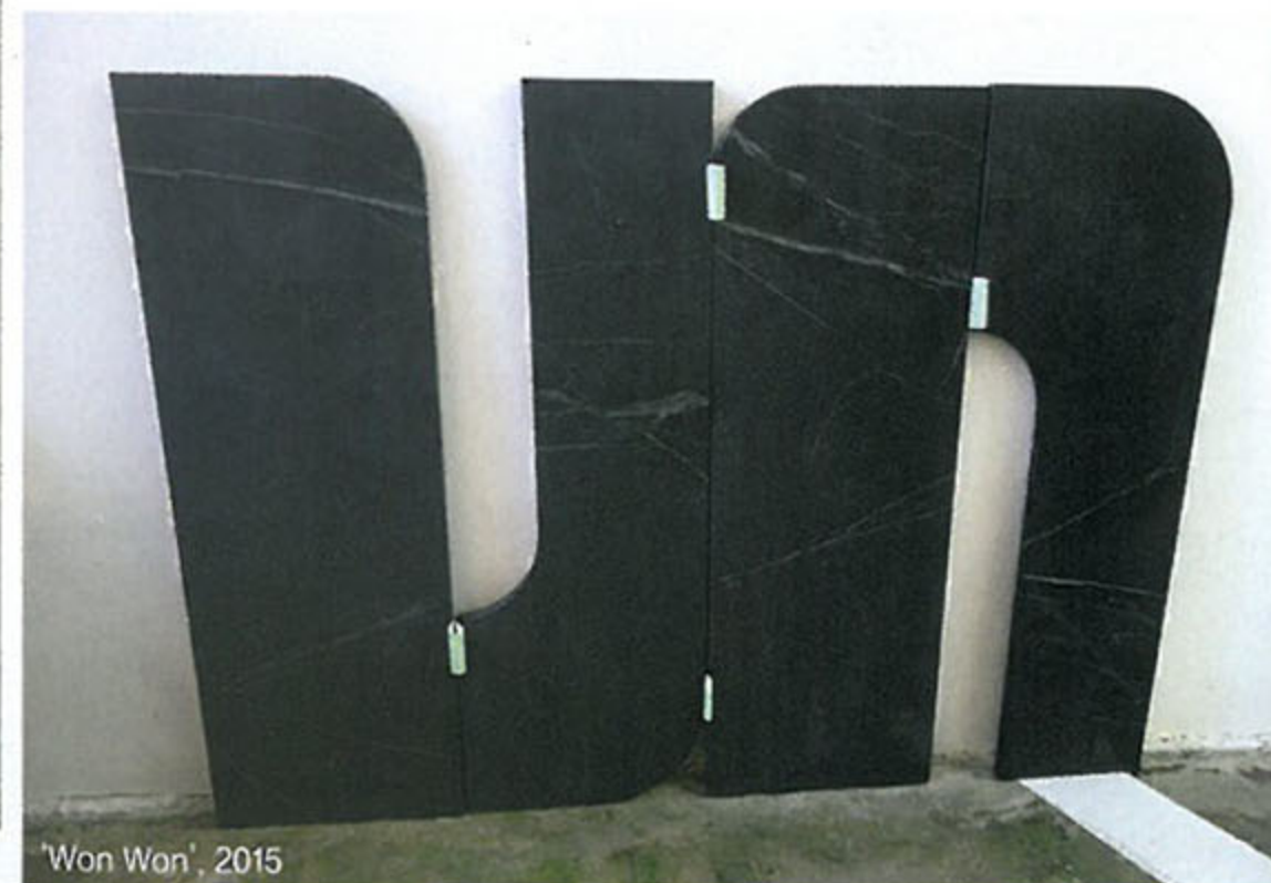
'Won Won', 2015