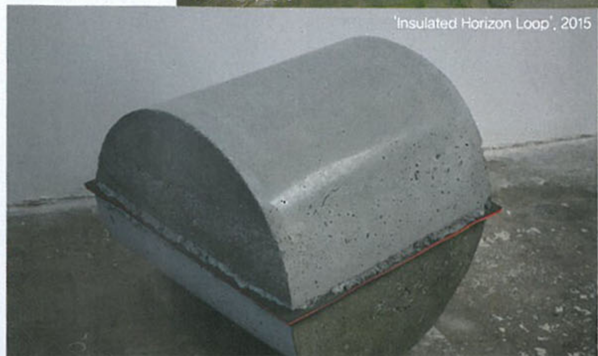
'Insulated Horizon Loop', 2015