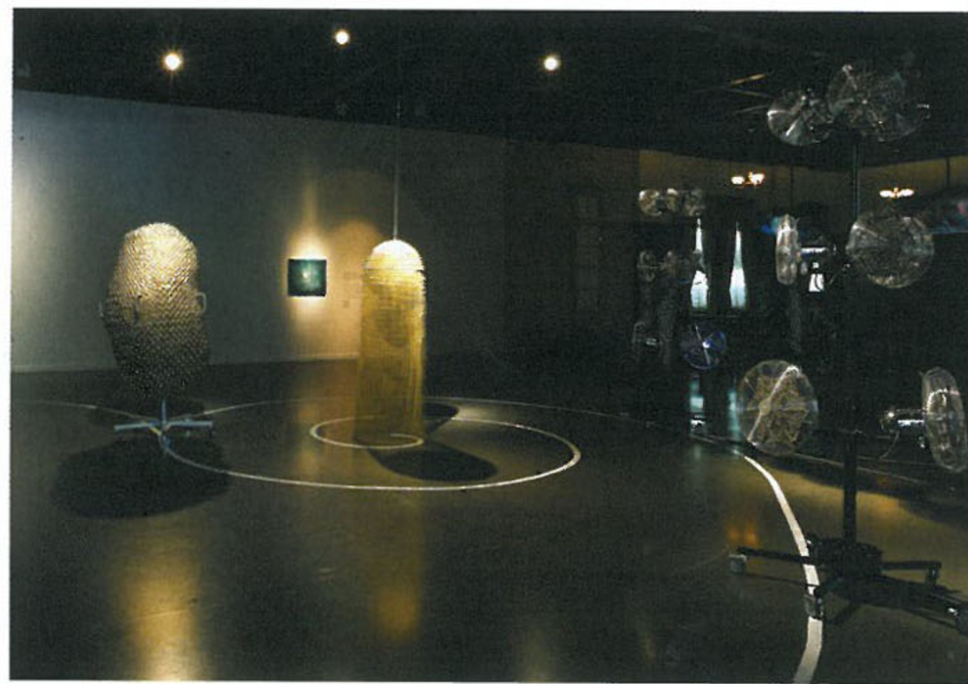
전시장 1층에 설치된 양혜규의 작품. 바닥 테이프로 표시된 나선형의 궤도 중심에 위치한 <소리 나는 보름달-중량 중형 #2>와 손잡이를 잡고 전시공간을 돌아다닐 수 있는 <소리 나는 춤-이복 언니> 2014

무속 연구가들이 기록한 굿은 내가 서울에 와서 보았던 퍼포먼스에 가까운 굿들보다는 훨씬 굿 같았다. 굿의 원형들이 담긴 비디