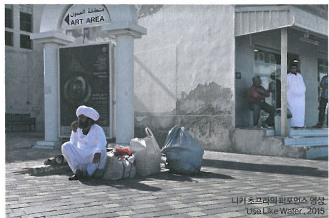
니키 초프라의 퍼포먼스 영상 'Use Like Water', 2015