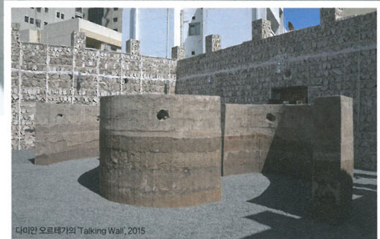
다미안 오르테가의 'Talking Wall', 2015