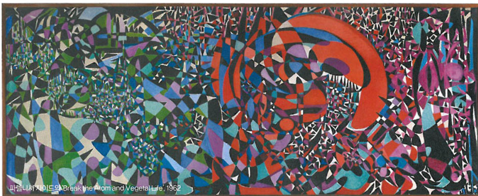
파렐니사지이드의 'Break the Atom and Vegetal Life', 1962

특히 한국 작가들에게 중동은 조금 특별할지도 모르겠다. 양혜규의 말처럼 중동과 한국은 과거 꽤 가까운 산업적 거리에 있었음에도 불구하고 문화적, 감성적인 관계로는 소통되지 않았고, 그건 지금도 다르지 않다. 하지만 기억을 더듬어보면, 한두 명의 친구들은 '중동에 간 아버지'를 두었고, 이들은 때가 되면 미제 과자와 학용품을 학교에 갖고 왔던 것 같다. 아티스트 그룹 '믹스'