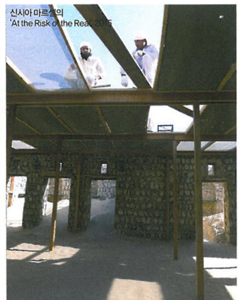
신시아 마르셀의 'At the Risk of the Real', 2015