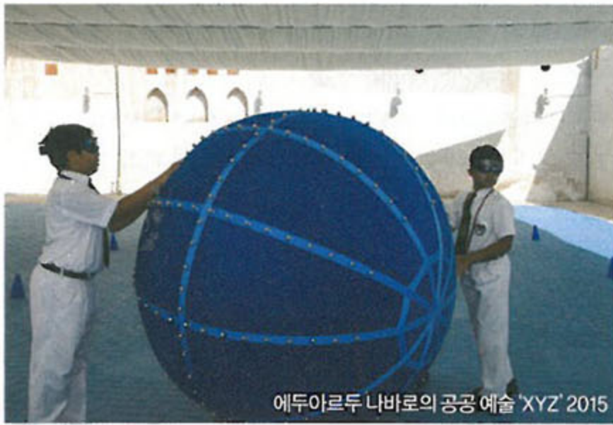
에두아르두 나바로의 공공 예술 'XYZ' 2015