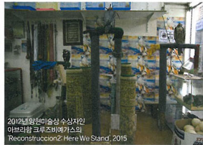
2012년 양현미술상 수상자인 아브라함 크루즈비예가의 'Reconstrucion2: Here We Stand', 2015

머물며 '장소특정적인' 작품을 고민했다. 샤르자 비엔날레는 예술 관련자들은 물론 연구기관과 학자들과의 커뮤니케이션까지 적극 주선하며 도시의 크고 작은 '현재'를 피상적이지 않게 담아내도록 후원했는데, 참여 작가들은 이 과정에 상당한 만족감을 표했다. 양혜규도 마찬가지였다. "도시계획학자, 고고학자 등에게 이 곳의 전통 건축에 대해 배운 적도 있어요. 다른 작가들과 토론하고, 워크숍 하고, 영화 보고, 퍼포먼스 보고, 프레젠테이션 듣고, 답사 가고... 이런 과정들이 굉장히 흥미로웠어요."