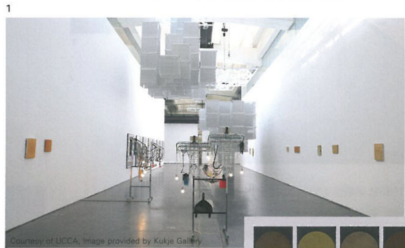
2 향신월(香辛月, Spice Moons ), Screen prints, sandpaper, spices, herbs, framed 8 panels set, each 166×115.5×4.5cm, 2013