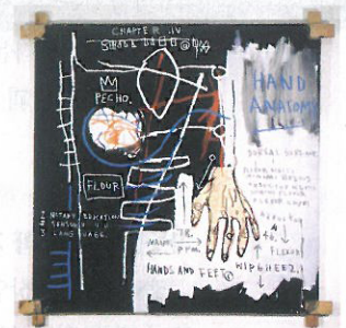
Untitled (Hand Anatomy), Acrylic, oilstick and paper collage on canvas with tied wood supports, 152.4x152.4 cm, 1982 (c)The Estate of Jean-Michel Basquiat_ADAGP, Paris_ARS, New York

바스키아는 비교적 짧은 생애에도 불구하고 광기 어리고 열정적인 작품 활동을 통해 동시대의 중요한 작품 세계를 구축했다. 작품 주제는 앞서 언급한대로 자전적 이야기, 흑인 영웅, 만화책, 해부학, 낙서, 낙서와 관련된 기호 및 상징뿐 아니라 금전적 가치, 인종주의, 죽음과 관련한 그만의 시적 문구 등으로 구성됐다. 이와 같은 주제들은 때때로 경계가 불분명하며 복합적이지만 작품에 지속적으로 나타나는 기호, 문자, 인물, 등의 양식을 통해 작가의 의도를 유추해 볼 수 있다.