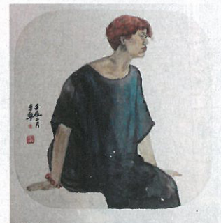
인물사생, 40x40cm, 2012

이준 작품의 다른 한 특색은 사생이 창작활동에 중요한 요소를 강조하는 것이다. 작가는 늘 현실 생활과 시대정신에 관심을 가져야한다고 본다. 마흔 살이 된 이준은 중국 회단에서 성과를 얻었고 세계적으로도 주목받는 작가의 길을 가고 있다.