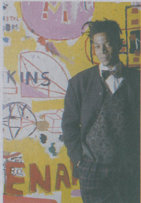
Jean-Michel Basquiat (American, 1960-1988)