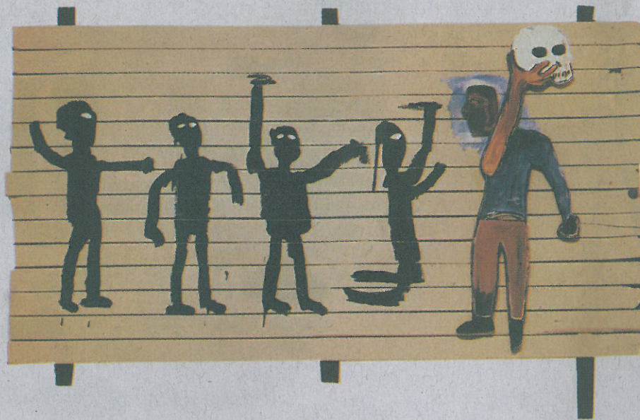
Procession 1986 Acrylic and wood relief on wood 162 x 244 cm

특히 작가 사이 톰블리(Cy Twombly)의 영향은 낙서 같은 외관으로 그에게 강한 인상을 주었고, 해부학 외에도 풍부한 낙서이미지를 위해 아프리카의 암벽미술,