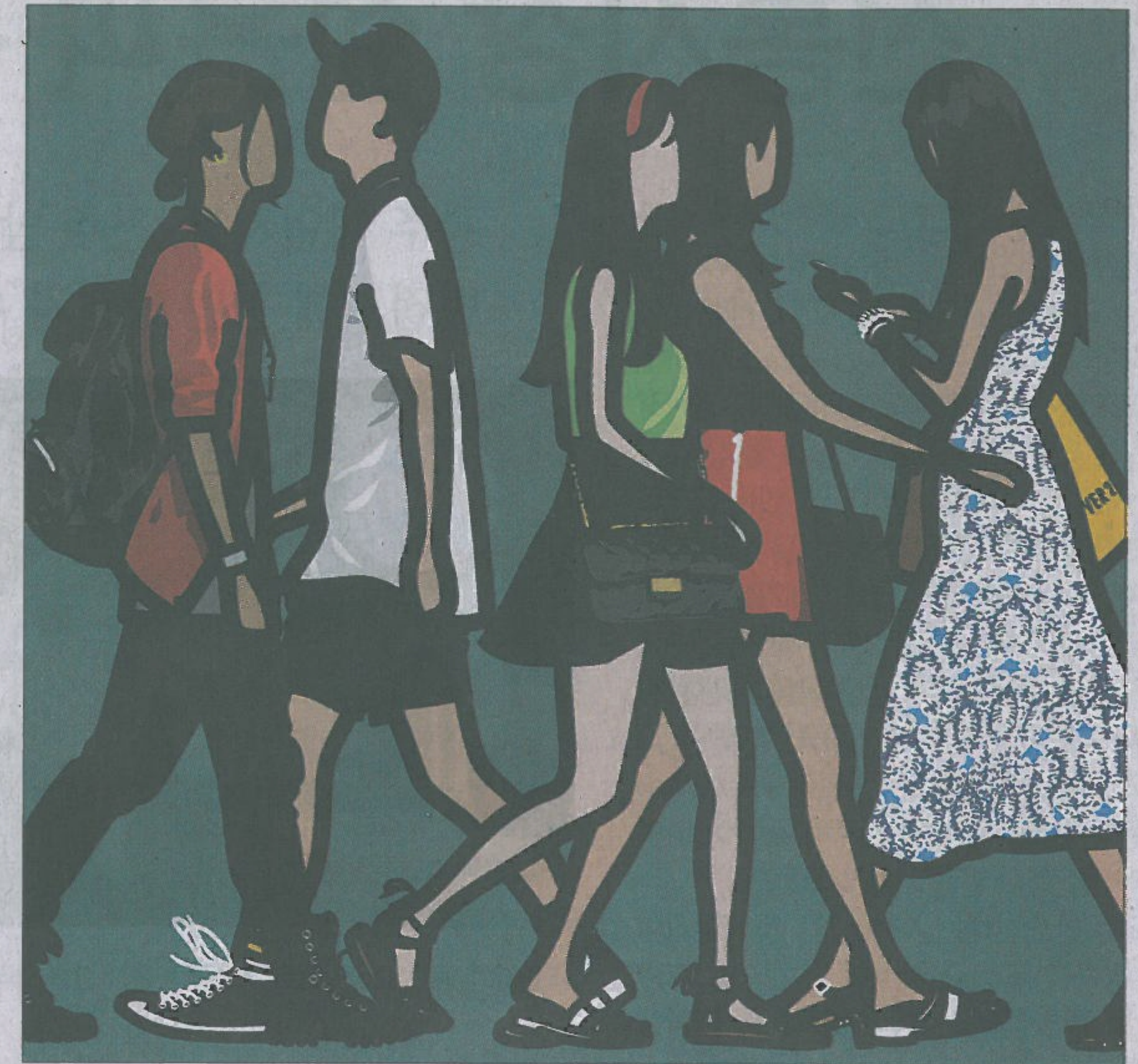
줄리안 오피의 '신사동 거리를 걷는 사람들 (Walking in Sinsa-dong)'

이처럼 기억과 현실 사이 거리의 모습에 주목한 다양한 작업을 지속해 온 설치작가 구현모(40)가 새로운 작품을