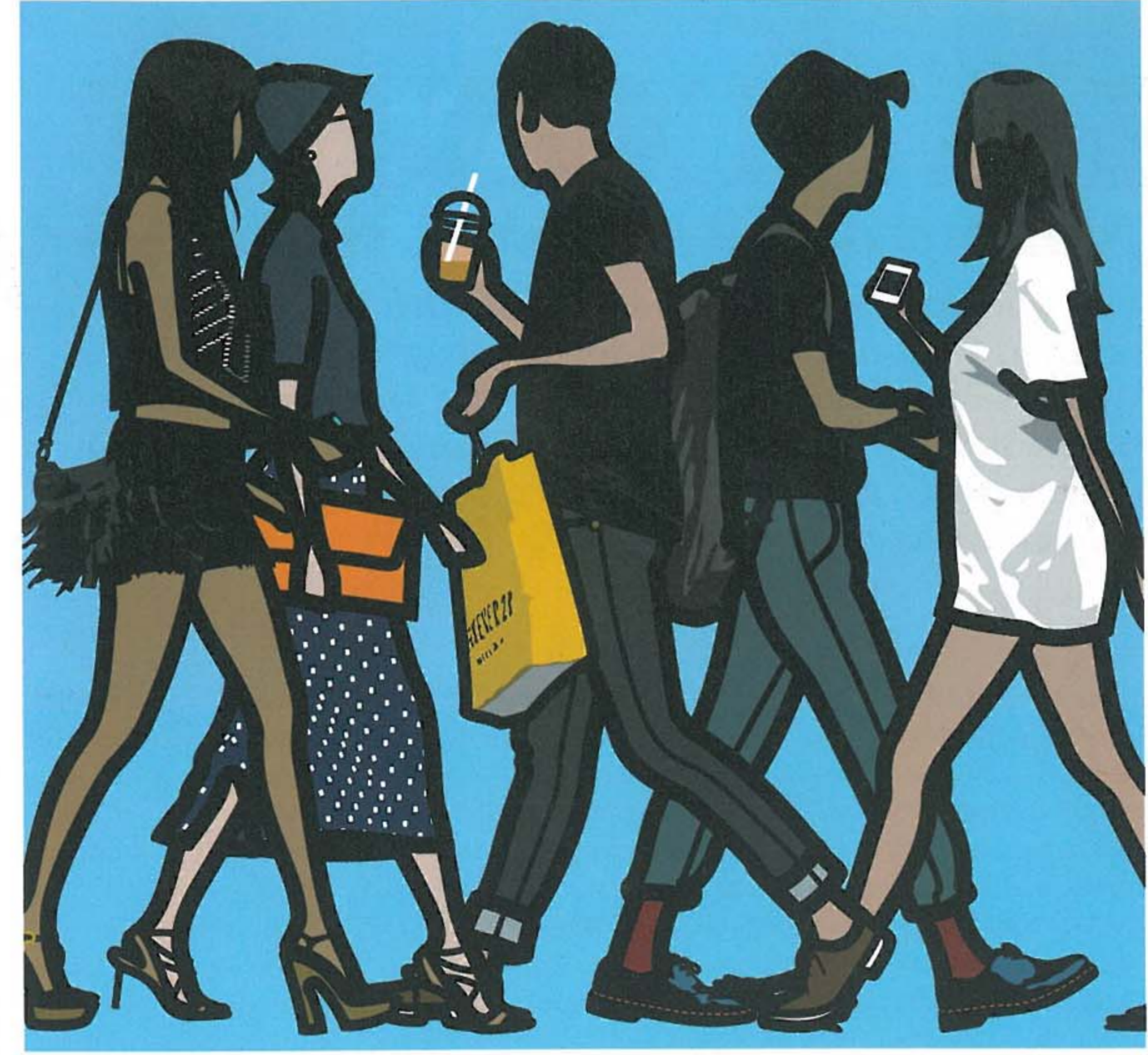
Julian Opie, Walking in Sinsa-dong 1 & 2 & 3 , 2014, Vinyl on Wooden Stretcher, 220 x 233.6cm (each)