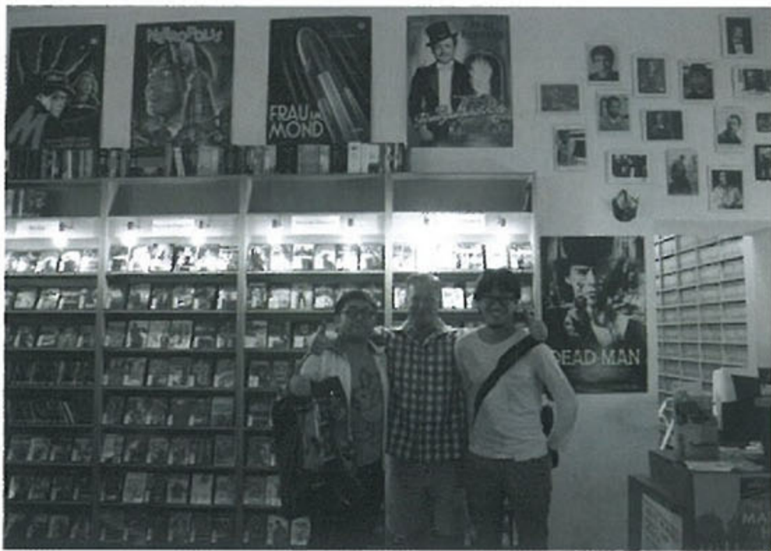
2011년에서 2013년까지 진행된 한국-엔에르베(NRW), 독일과 한국에서 각각 선발된 7인의 작가가 3년간 양국을 오갔고, 풍성한 시간을 쌓았다. 중요한 것은 3년이라는 시간이 아니라, 그 시간 속에 남은 정서적인 유대감과 신뢰다.