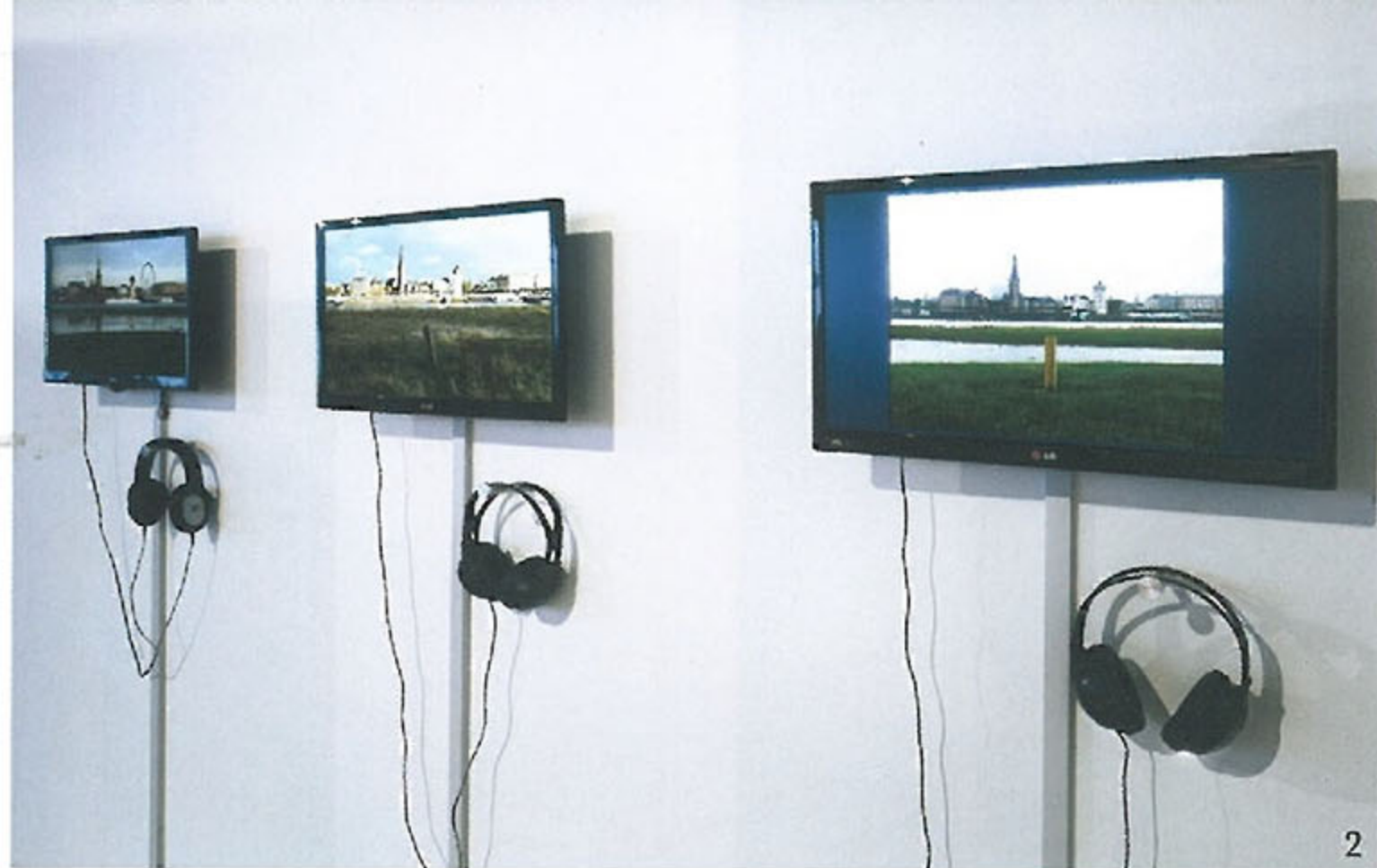
나현 작가는 <로렐라이의 노래>에 뒤셀도르프 라인강과 한국 4대강의 시간을 담았다.

한국은 공공 미술 기관조차 똑딱, 한 달이면 전시를 만들어내는 놀라운 나라다. 아무리 짧은 시간이 주어저도 작품 수준도 괜찮고 멀쩡한 도록도 나온다. 빨리빨리, 그리고 최고의 결과물을 만드는 게 조금도 이상하지 않은 선수들에게 이번 프로젝트는 좀 당황스러웠다. 잘 달리기로 소문난 말에게 느릿한 낙타의 걸음을 걸으라는 것과 다를 바 없었으니까. 트랜스페어 한국-엔에르베(NRW)에는 2011년에서 2013년까지, 3년의 시간이 걸렸다.