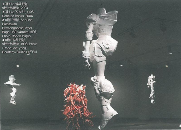
1 김소라, 설치 전경, 아트선재센터, 2004 2 김소라, 도서관, 1106 Donated Books, 2004 3 이불, '화형', Sequins, Potassium Permanganate, Mylar Bags, 360×410cm, 1997 4 이불, 설치 전경, 아트선재센터, 1998

다. 전시의 하이라이트는 화려한 장식의 생선 98마리를 비닐에 넣고 벽에 걸어 전시한 이불의 '잠업 한 광채'. 생선 썩는 냄새로 MoMA에서 철거되기도 했던 논란의 작품이 20년 만에 처음 대중에게 공개 되는 것이다. 이불뿐 아니라 1980년대에 그녀와 함께 소속했던 그룹 '뮤지엄'의 작가 김소라, 정서영도 참여한다. 세 명 작가들의 1990년대 말부터 2000년 초반까지 주요 작업을 살펴보는 이번 전시는 이 시기 작품들이 과거에 멈춰 있는 것이 아니라 현재 우리와 '여전히 움직임'을 시사한다. 전시 중 아티스트 토크도 마련되어 있으니 관심 있는 작가의 일정을 확인해 볼 것. 11월 20일까지 진행된다.