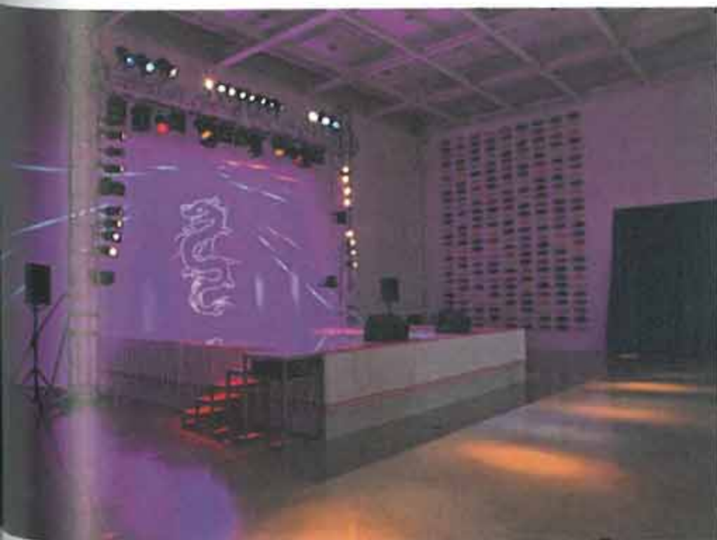
'크레용팝 스페셜', 2014