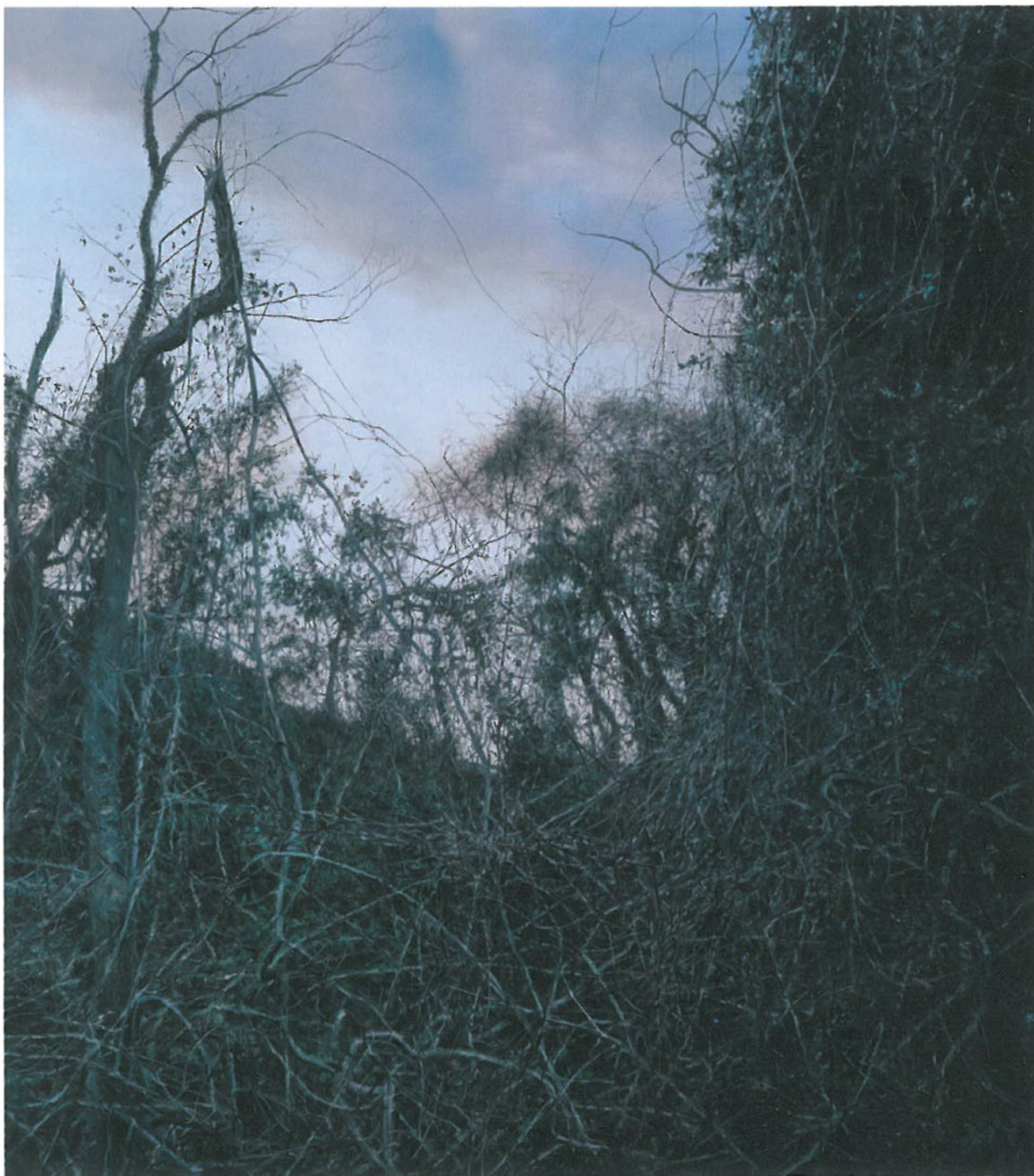
Untitled 0420 · 100x100cm · Oil on canvas · 2014

K1전시장1층에서는 낮의 풍경을 중심으로 한 대규모3패널 회화작품을 비롯하여,눈이 아직 녹지 않은 축축한 느낌의 덩불 숲,새벽녘의 실 빛이 들어오는 자욱한 숲의 절경 등 계절과 날씨의 변화에 따른 다양한 이미지들을 볼 수 있다.2층의 전시는 밤의 풍경을 담은 작품들로 구성되어있으며,오감을 활용한 감각적인 이미지들을 검은 벽면과 조명을 통해 설치하여 실제로 작가가 경험한 심상을 공유하고자 한다. (문의: 02-735-8449)