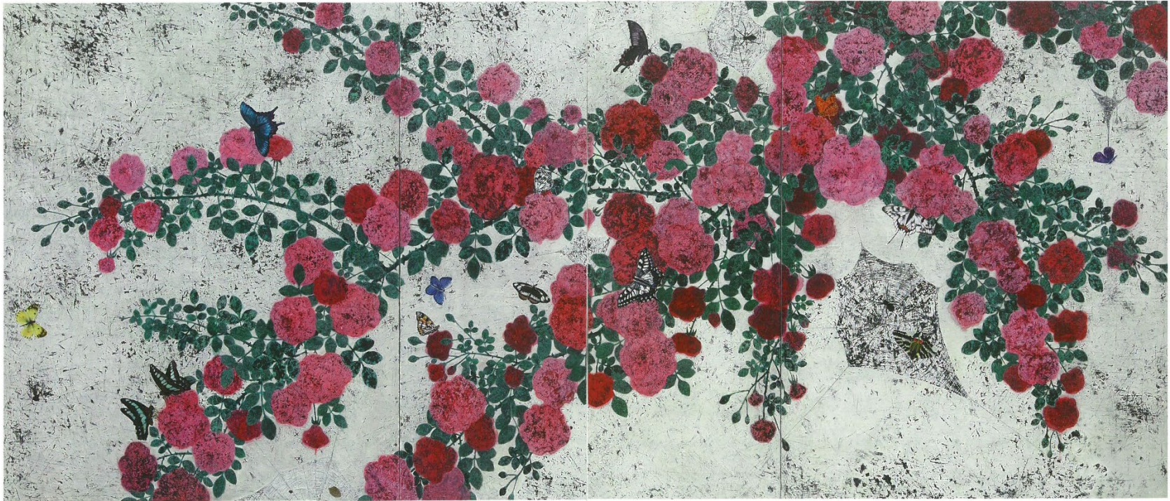
〈그날 숲〉 캔버스에 혼합재료, 162x392cm 2018-2019