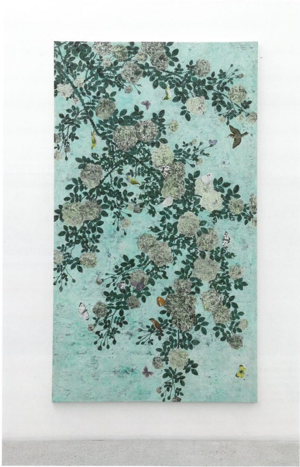
《그냥 숲》 캔버스에 혼합재료 309×175cm 2019 국제갤러리 K3 전시 공간