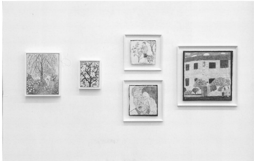
국제갤러리 K2 전시공간 원목부터 (영원)과 남사) 캔버스에 혼합재료 34.8×27.5cm 2018 (3월) 캔버스에 유합재료 22×15cm 2018 (정미워 나) 캔버스에 점토, 연필 21×22.5cm 2017 (숲을) 캔버스에 점토, 연필 21×22.5cm 2017 (연영) 캔버스에 혼합재료 43×43cm 2017

세부를 놓치지 않으면서도 전체를 바라보는 문성식의 특유의 시선은 국제갤러리 개인전에서 전시된 (그냥 삶)(2019)이라는 새로운 연작에서도 나타난다. 이 근작들에서 그는 조신시대 화조도나 초충도와 같은 전통 그림의 형식을 활용하는 새로운 시도들