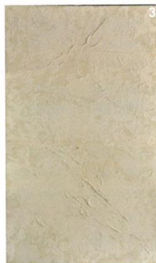
1, Meditation 91108 2, Return 77-M 3, Tak 86921